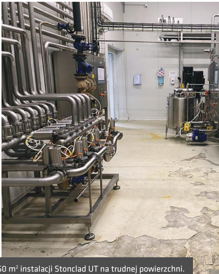
60 m 2 instalacji Stonclad UT na trudnej powierzchni.

Stonhard wyróżnia się od konkurencji Stonhard jest bezprecedensowym światowym liderem w produkcji i instalacji wysokowydajnych polimerowych systemów podłogowych, ściennych i okładzin chemoodpornych. Stonhard zatrudnia 300 kierowników regionalnych i 175 ekip instalacyjnych na całym Świecie, które współpracują z Klientem w zakresie specyfikacji projektu, zarządzania projektami, końcowych inspekcji i serwisu posprzedażowego. Pojedyncze źródło gwarancji Stonhard obejmuje zarówno produkty, jak i instalację.